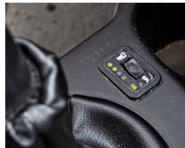
Schalter, um den Betrieb mit Gas oder Benzin zu wählen