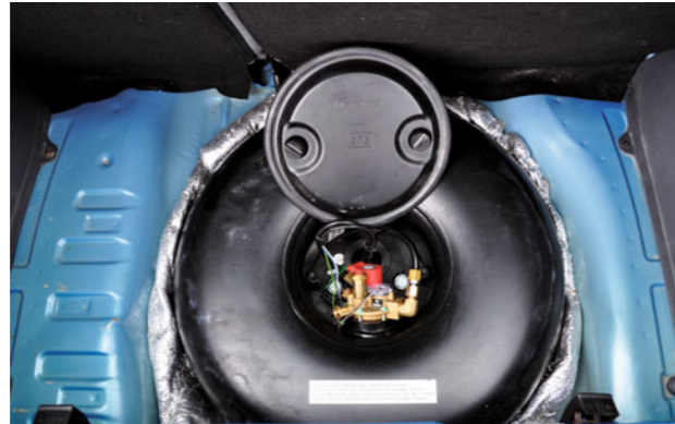
Gastank in Reserveradmulde