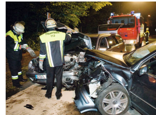
Bei einem Frontalzusammenstoß besteht bei Gasfahrzeugen kein erhöhtes Sicherheitsrisiko

in denen Erdgas mit einem Druck von 200 bar gespeichert wird, sind aus Spezialstahl und für eine Druckbelastung von 600 bar (Berstdruck) ausgelegt. Jeder Behälter wird vor dem Einbau individuell geprüft. Zum zusätzlichen Schutz und im Falle einer Kollision sind die Tanks in einer stabilen Stahlrohrkonstruktion montiert.