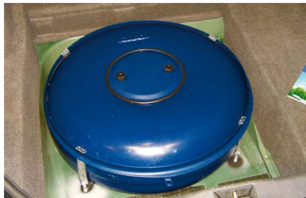
Gastank in Reserveradmulde

Fast jedes Fahrzeug mit Ottomotor kann für etwa 1500-3500 Euro umgebaut werden. Das Leergewicht einer Flüssiggas-Anlage beträgt etwa 40 kg. Der Tank findet seinen Platz entweder in der Reserveradmulde (das Reserverad wird dann durch ein Pannenspray ersetzt) oder im Kofferraum. Auch Unterflurtanks sind möglich. Die Reichweite beträgt je nach Verbrauch 350-1000 km.