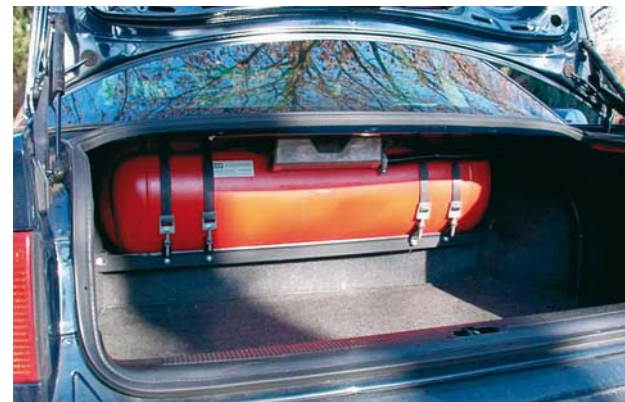
Gastank im Kofferraum