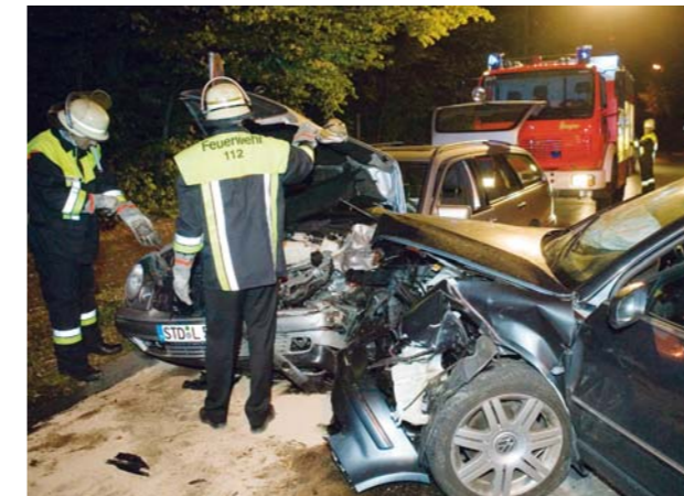
Bei einem Frontalzusammenstoß besteht bei Gasfahrzeugen kein erhöhtes Sicherheitsrisiko.

in denen Erdgas mit einem Druck von 200 bar gespeichert wird, sind aus Spezialstahl und für eine Druckbelastung von 600 bar (Berstdruck) ausgelegt. Jeder Behälter wird vor dem Einbau individuell geprüft. Zum zusätzlichen Schutz und im Falle einer Kollision sind die Tanks in einer stabilen Stahlrohrkonstruktion montiert.