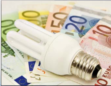
1.) Energiekosten senken