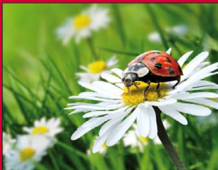
4.) Umweltschutz praktizieren