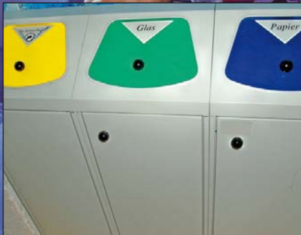
2.) Abfälle reduzieren